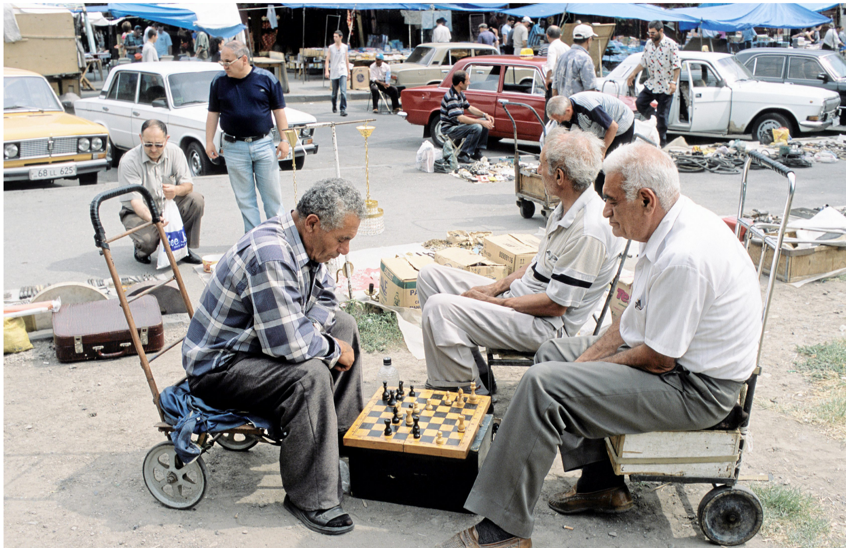
▲ Mænd spiller skak på et marked i den armenske hovedstad, Jerevan. Fra 2008 til 2012 er fattigdommen i landet fordoblet.